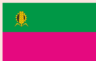
Флаг Запорізького району

Запорізький район розташований у північній частині Запорізької області. Загальна площа району становить 1462 кв. км, географічно він розташований по берегах ріки Дніпро навколо міста Запоріжжя. Район приміський, без районного центру, роз'єднаний на дві частини рікою Дніпро та містом Запоріжжя.